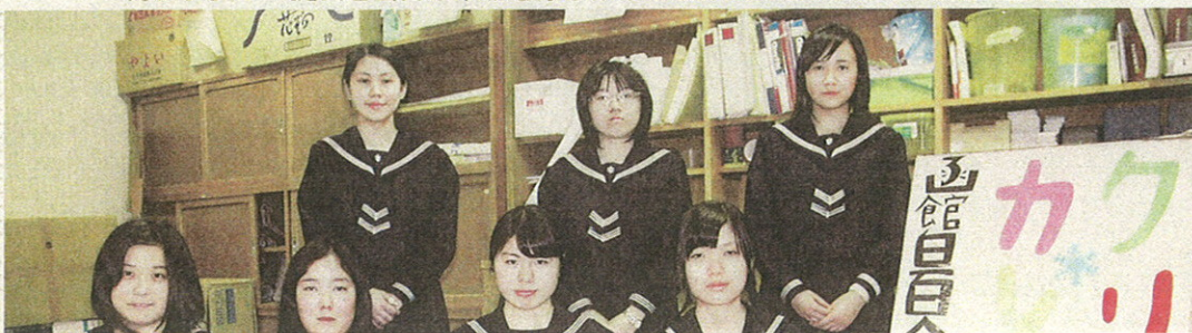
カレンダーの提供と当日の来場を呼びかける函館白百合学園中学高校福祉局員